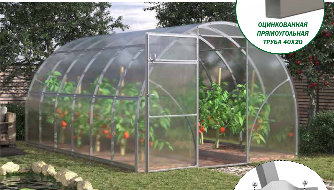
ОЦИНКОВАННАЯ ПРЯМОУГОЛЬНАЯ ТРУБА 40X20